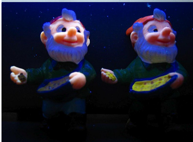
Saatgut dunkel (Gesicht hell) und Saatgut hell (Gesicht dunkel).